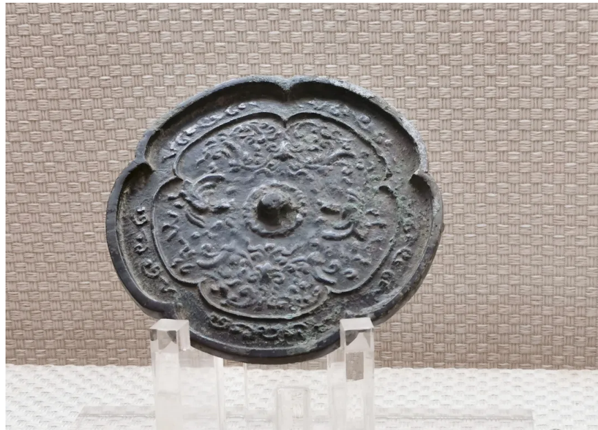
# 环亚馆藏珍贵文物 五代·凤穿牡丹葵花铜镜

本次评估参评博物馆总数超过1000家，其中一级博物馆超过100家、一级博物馆超过100家、二级博物馆通过率为77.3%、三级博物馆通过率为55.7%。